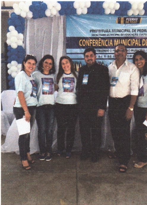
Fotografias da Conferência Municipal de Educação realizada nos dias 04 e 05 de novembro de 2014